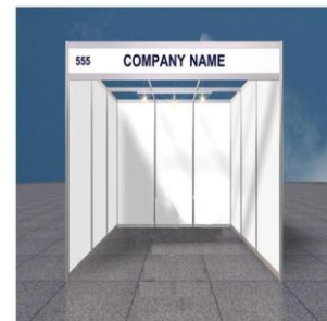
Shell Scheme Stand Sketch (For illustrative purposes only)

Nota: El alquiler de espacio no incluye mueble o limpieza del stand. Todos estos servicios, entre otros, podrán ser ordenados en el Manual Técnico de Exposición.