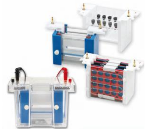
Cubetas verticales y módulos de electroblotting